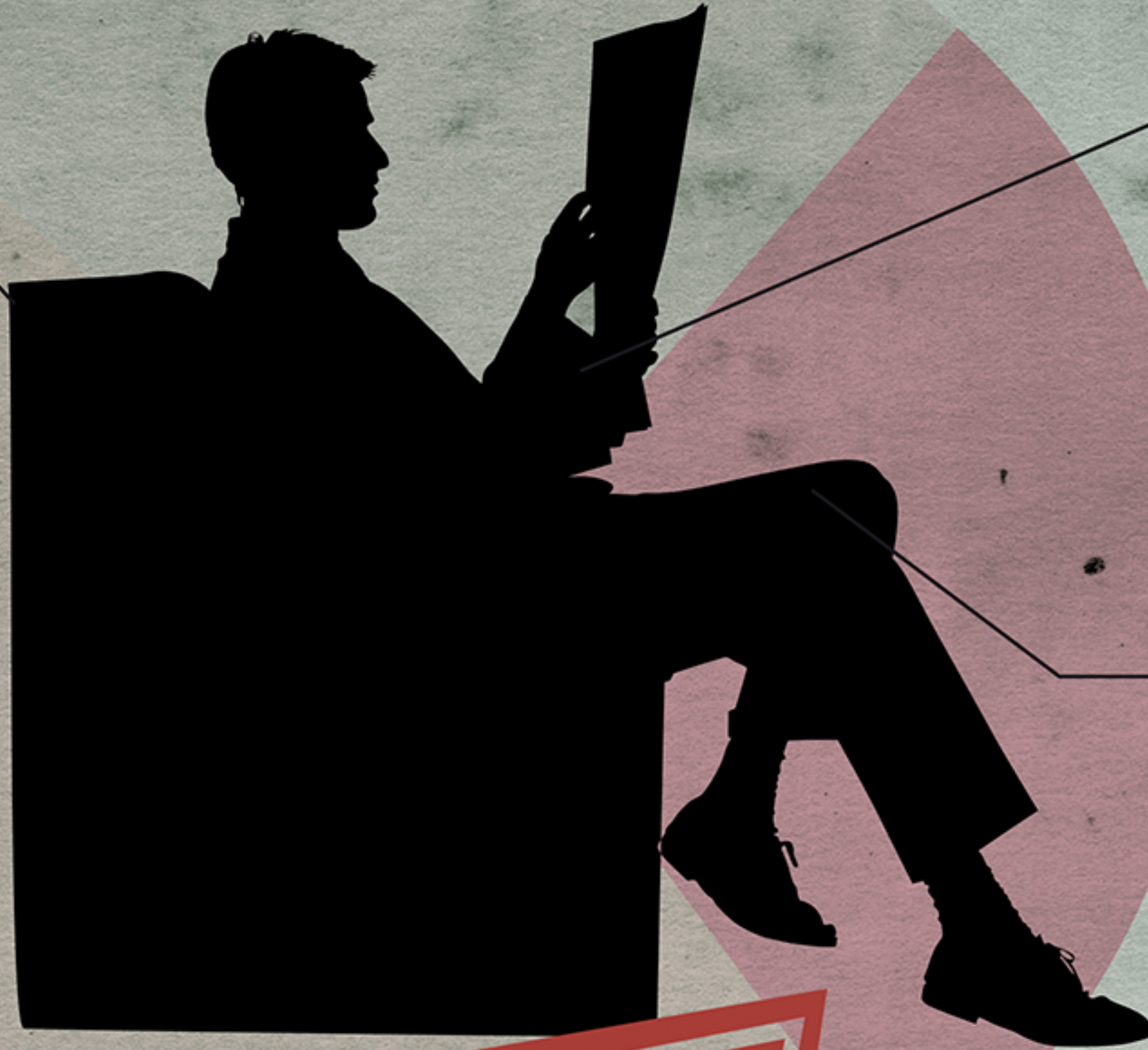
fig. 2: Medios ¿Qué Derechos Humanos crees que se están vulnerando?