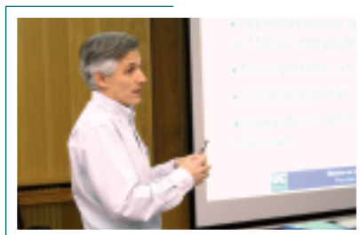
Conferencia del Sábado de la Ciencia.

Los ciclos de conferencias se iniciaron con un primer ciclo sobre Jornadas de Oceanografía y Biología Marina en colaboración con el Instituto Oceanográfico. El segundo ciclo titulado Estrategia de uso sostenible de los recursos de la geodiversidad ha sido un adelanto de la celebración del Año Internacional del Planeta Tierra 2008. El tercer ciclo Fronteras de la Física se ha organizado en colaboración con la Facultad de Ciencias. El cuarto ciclo Biotecnología para todo(s) , se llevó a cabo con el Departamento de Biología Molecular. Finalmente, el Aula se ha sumado a la promoción de la Astronomía con el patrocinio de la conferencia Otros mundos en el universo por Michel Mayor en colaboración con el IFCA.