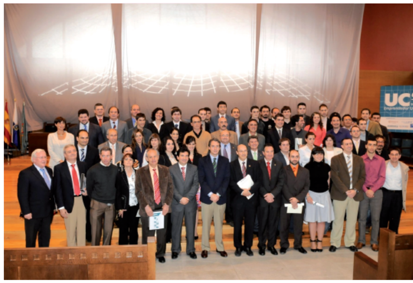
Entrega de los premios al Emprendedor Universitario.

El Centro de Orientación e Información de Empleo asistió a varios congresos, reuniones y jornadas formativas, y gestionó la participación de la Universidad de Cantabria en accio-