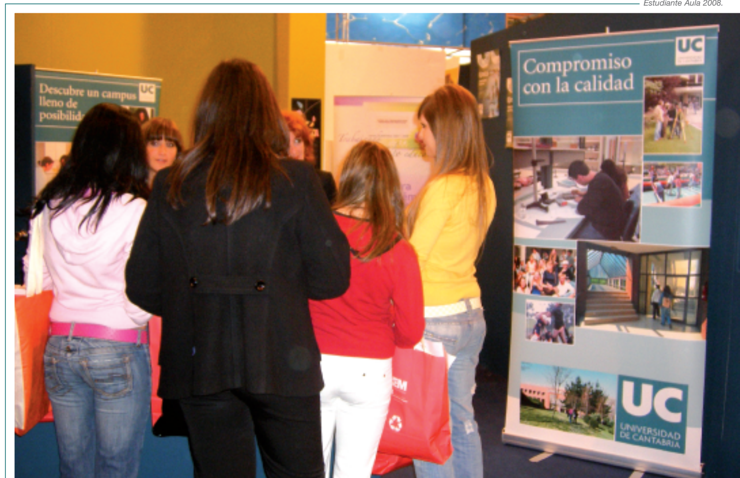
La UC estuvo presente en el Salón Internacional del Estudiante Aula 2008.

El día 23 de mayo, en el Paraninfo de la UC, se celebró el Acto de la Entrega de Premios a los ganadores de las Olimpiadas de Matemáticas, Física, Química,