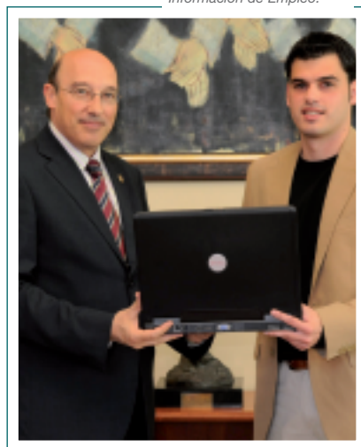
Entrega de premios del Centro de Orientación e Información de Empleo.

nes subvencionadas como las becas Eurolabora del Programa Leonardo da Vinci, el programa regional Emprecan de SODERCAN, programas de prácticas en empresas extranjeras y en la administración local, y programa de acompañamiento y refuerzo educativo de la Consejería de Educación.