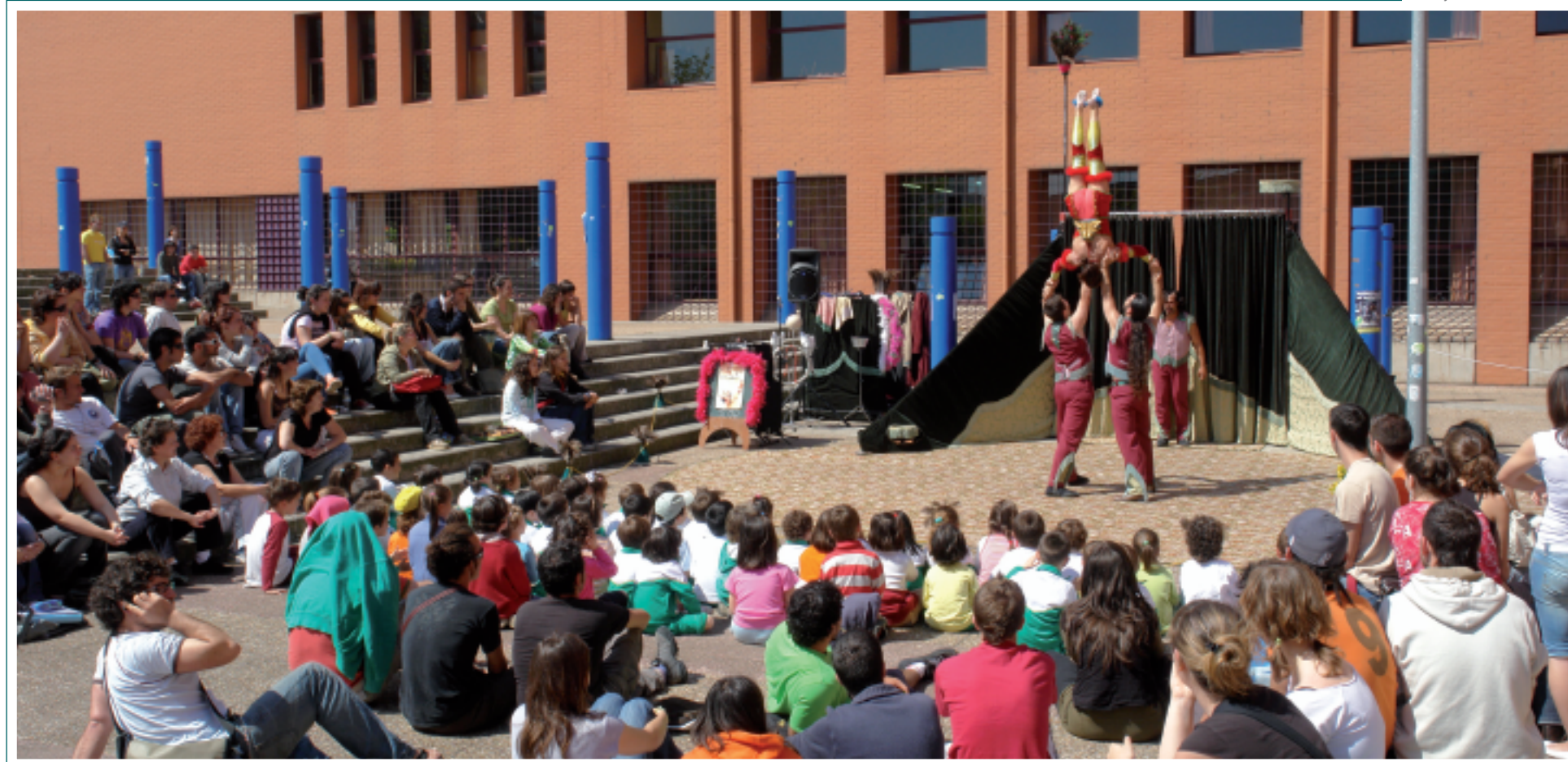
El ciclo Teatro en el Campus se desarrolló durante el mes de mayo.

Además ha llevado a cabo su programación teatral con las representaciones de La Machina Teatro: Tu ternura Molo-tov de Gustavo Ott y Robinson y Crusoe de Nino D'Introna y Giacomo Ravi-chio. Además la compañía Malabaracir-co representó El circo animado durante la inauguración Plaza de la Ciencia. Dentro del ciclo Teatro en el Campus participaron las compañías de teatro de calle No Somos Monstruos Teatro y Teatro Destellos.