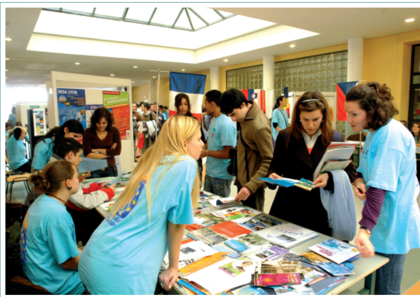
La Oficina de Relaciones Internacionales organizó el Día Internacional de la UC.

Bajo los auspicios del convenio con la Universidad Tecnológica de Sydney, se ha recibido un tercer grupo de estudiantes. Continúan, asimismo, los cursos para estudiantes de universidades estadounidenses. En el marco del convenio con la Universidad de Chapman se han enviado 5 estudiantes del MBA para realizar prácticas durante el verano financiados por la Cámara de Comercio y el Banco de Santander.