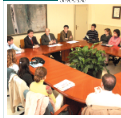
Reunión con los becarios de las oficinas de información universitaria.

Puertas Abiertas. El primero se desarrolló del 20 de noviembre al 21 de febrero en 59 centros de Secundaria de la región, con la asistencia de 2.433 alumnos de 2º de Bachillerato y Ciclos Formativos de Grado Superior.