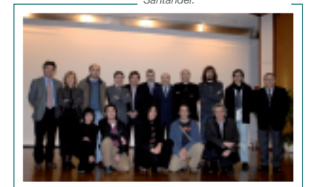
Ganadores del III Certamen de Cortos UC y Ciudad de Santander.