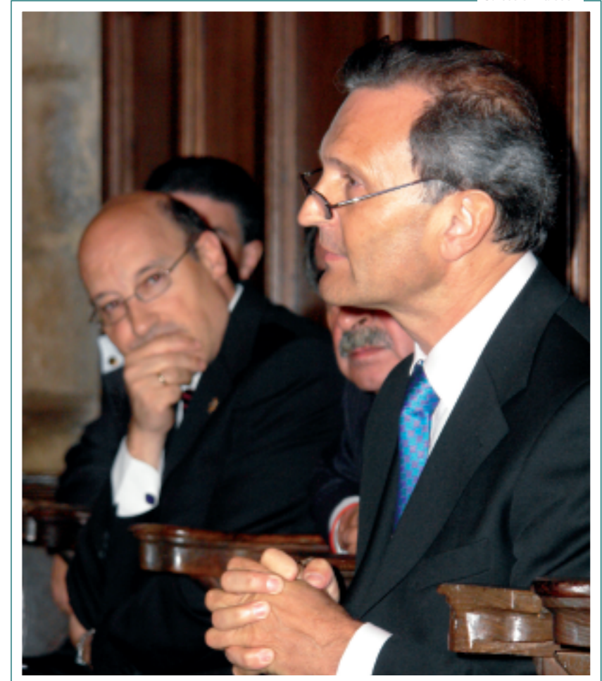
Inauguración de los Cursos en Laredo.

Laredo , sede central de los Cursos de Verano, acogió un total de 11 conferencias y 47 monográficos sobre temas muy diversos: medicina y salud, historia, derecho, tecnología, psicología, educación etc.