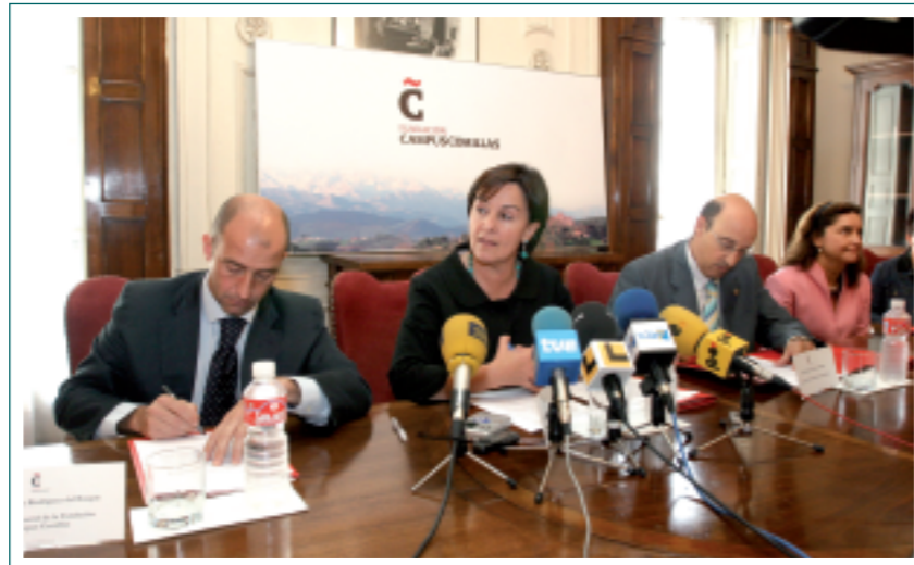
El Máster en Enseñanza del Español como Lengua Extranjera se ha implantado en colaboración con la Fundación Comillas.

Los Programas Oficiales de Posgrado están diseñados para la incorporación de los actuales titulados de primer ciclo y de primer y segundo ciclo -en tanto se implanten los primeros títulos de grado-, e incorporan también estudios de doctorado a los que se podrá acceder tras los correspondientes estudios de Máster.