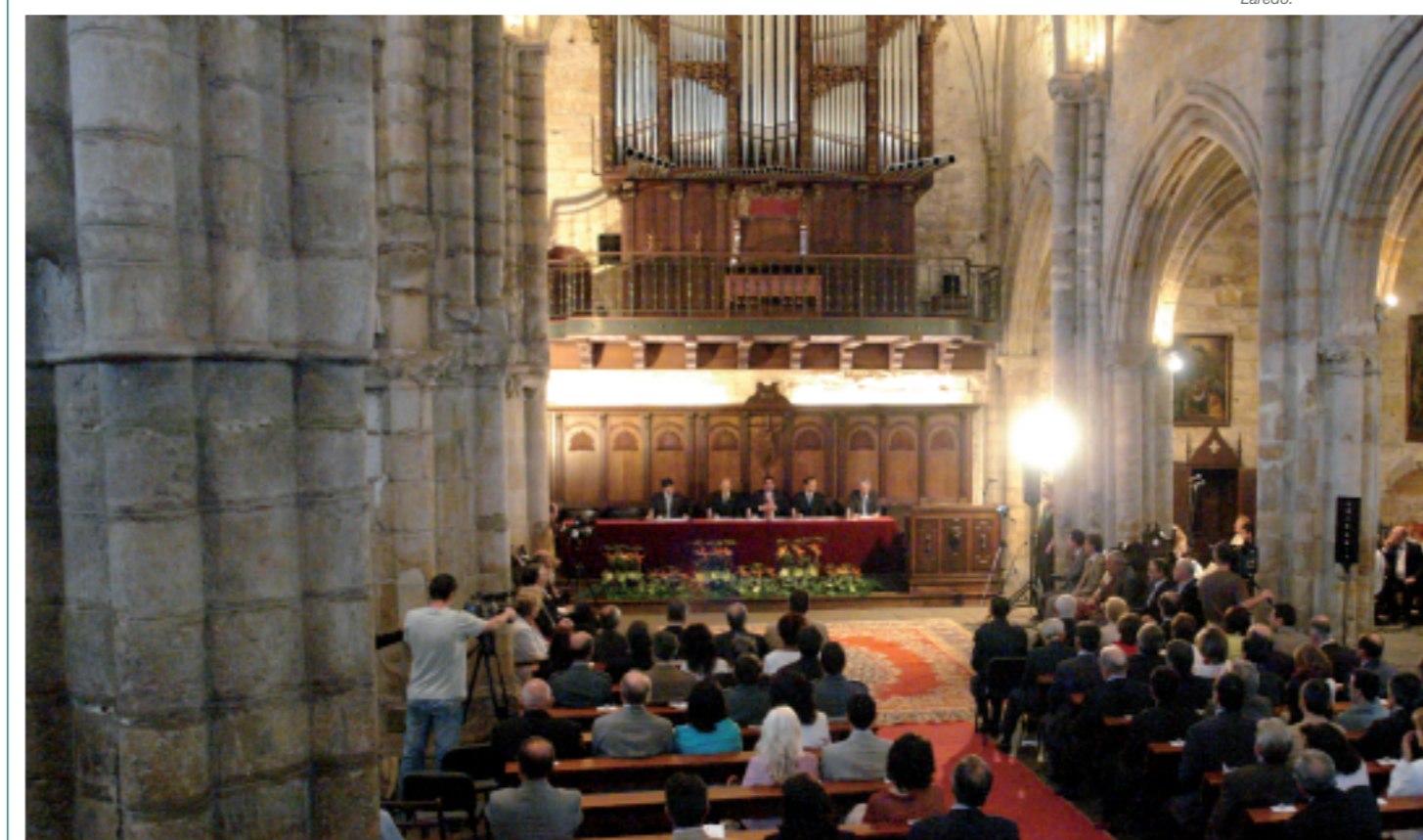
El acto de inauguración de los Cursos se celebra en la iglesia de Santa María de Laredo.