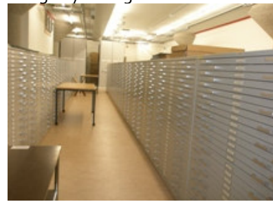
Biblioteca Central: inauguración oficial de las nuevas instalaciones de las colecciones especiales