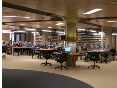
Biblioteca Central: depósitos de fondo antiguo y cartografía