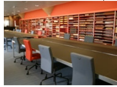
Biblioteca de la Facultad de Derecho: Sala principal y salas de trabajo en grupo