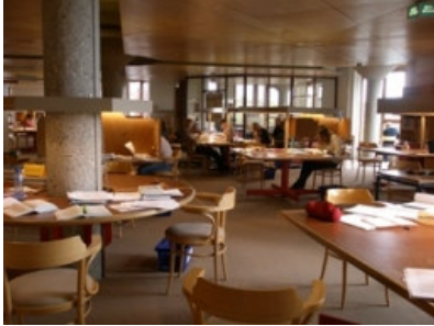
Biblioteca Central: Salas de estudio