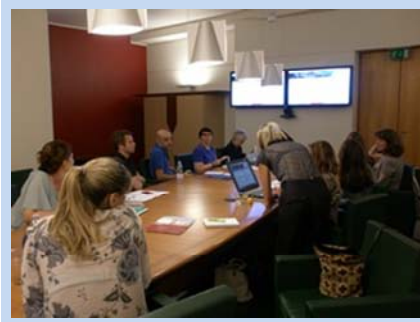
"Workshop" de Bibliotecas