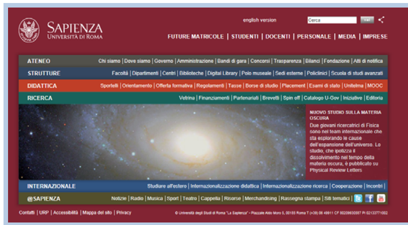
Web principal de La Sapienza

Todo ello con el objetivo de tener en cuenta las diferentes audiencias y de adaptar la página no sólo a la estructura lógica de los contenidos, sino al uso que de ella hacen los usuarios: explicó por ejemplo que los estudios demuestran que los jóvenes no buscan siguiendo la estructura sino que usan los buscadores internos de las páginas. Para ello, quieren: