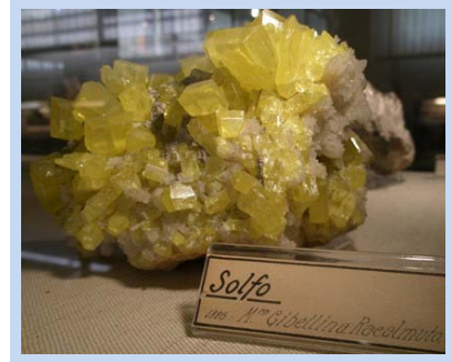
Azufre de Racalmuto (Sicilia)

Se ofreció a los participantes la posibilidad de visitar diversos Museos de la Sapienza, como el de Historia de la Medicina, o el de Mineralogía. En mi caso asistí a la visita al Museo de Mineralogía , el más antiguo de los museos de la Sapienza, con un interesante fondo que incluye todo tipo de minerales y algunas colecciones curiosas, como la de meteoritos o anillos papales.