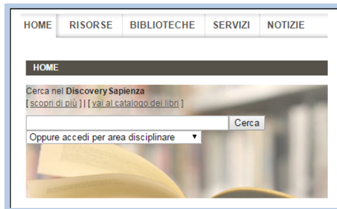
Diseño del “Discovery Sapienza”

A continuación pasó a describir la herramienta y las elecciones que han tenido que hacer para configurarla. Han optado, tras estudiar las páginas de bibliotecas de todo el mundo, por darle una posición central y prioritaria, por activar la búsqueda por disciplinas y por dejar enlaces visibles al resto de las herramientas, dejando en todo caso la posibilidad de reconsiderar este diseño si ven que conduce a confusión. Señala que las imperfecciones del Discovery son muchas, pero que es obviamente muchísimo mejor que nada y que en algunos casos (como Psycinfo) llega a buscar en las bases de datos mejor que sus propias herramientas. En todo caso, resaltó la importancia de presentar “mucho y bien” la herramienta a los estudiantes y a todos sus usuarios potenciales.