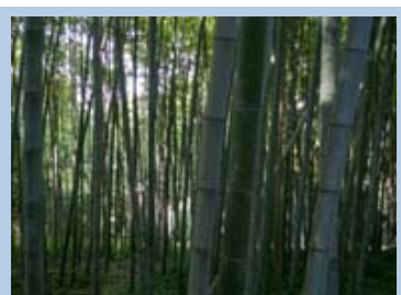
Bosque de bambú en el "Orto Botanico"

La tarde el jueves se organizaron sendas visitas a la Biblioteca della Accademia Nazionale e dei Lincei y al Jardín botánico , que es uno más de los Museos de La Sapienza.