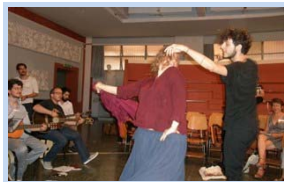
Actuación de "Etnomusa"

Tuvo lugar un pequeño concierto a cargo de dos de las agrupaciones (música clásica y étnica) de MuSa , el proyecto de "Música en la Sapienza".