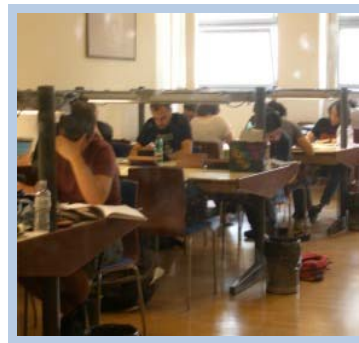
Biblioteca de Física (2005)