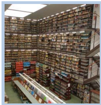
Biblioteca de Matemáticas (1935)

Fuera de programa y dado el interés mostrado por los participantes, se ofreció al grupo de bibliotecas la posibilidad de visitar, a modo de contraste, las Bibliotecas de Matemáticas y Física . La primera conserva la estructura original de los años 30 y de ella se destacó fundamentalmente el hecho de haber sido un espacio creado para ser Biblioteca, algo que no siempre es frecuente en Italia. La segunda, abierta en 2005, es una Biblioteca mucho más moderna, con un mobiliario adaptado a las necesidades actuales, equipada para que sus usuarios puedan entrar fuera de horario, etc.