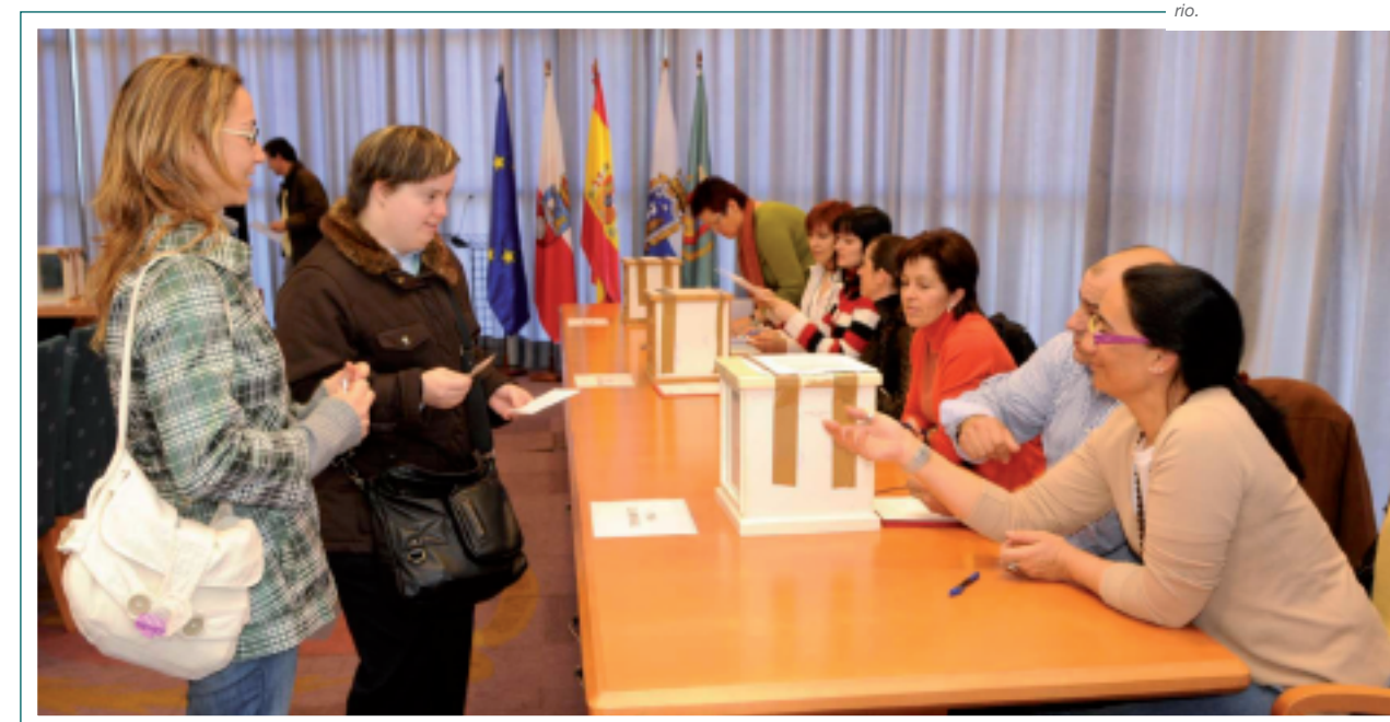
El 11 de marzo de 2008 se celebraron las elecciones para el Claustro Universitario.

sonal Docente de la Universidad de Cantabria, así como la evaluación de tramos por méritos docentes, las tarifas del Servicio de Establación y Experimentación Animal (SEEA), la concesión de subvenciones a los Cursos Verano y al Aula de Cine, la aprobación de la Memoria de Liquidación del Presupuesto del año 2007 de la Universidad, el informe favorable de Titulaciones de Grado de la Universidad de Cantabria adaptadas al EEES y la propuesta de incremento de las tarifas vigentes para el curso académico 2007/2008.