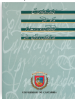
Los Estatutos de la UC recogen el funcionamiento de sus órganos de gobierno.

2007. También se aprobaron distintas normativas, entre las que destacan la de prácticas internacionales, la que regula los concursos de acceso a cuerpos docentes entre acreditados, la de los servicios científico-técnicos de investigación, el reglamento de uso de recursos de tecnologías de la información y comunicaciones y la normativa para la integración y consolidación de las plazas de plantilla de investigación de la Universidad de Cantabria.