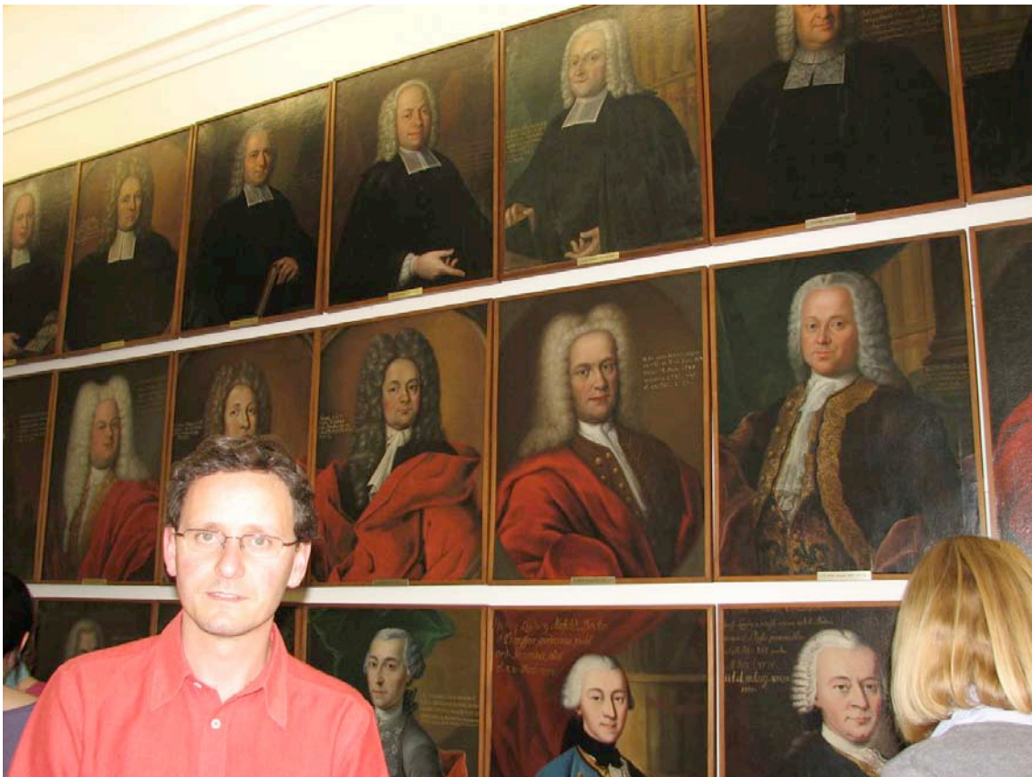
Sala de reuniones de la Universidad de Giessen

La reunión se realizó en la sala de reuniones de la Universidad. Contaba esta sala con retratos de los más ilustres profesores de la Universidad de los siglos XVII y XVIII. En aquella época los profesores debían pagarse sus propios retratos, lo cual se aprecia en su calidad: los que disponía de más medios económicos se hacían retratar con todo lujo de detalles, como por ejemplo los bordados del traje; en cambio, los menos pudientes prescindían de todo lo superficial, en algunos casos incluso del dibujo de las manos.