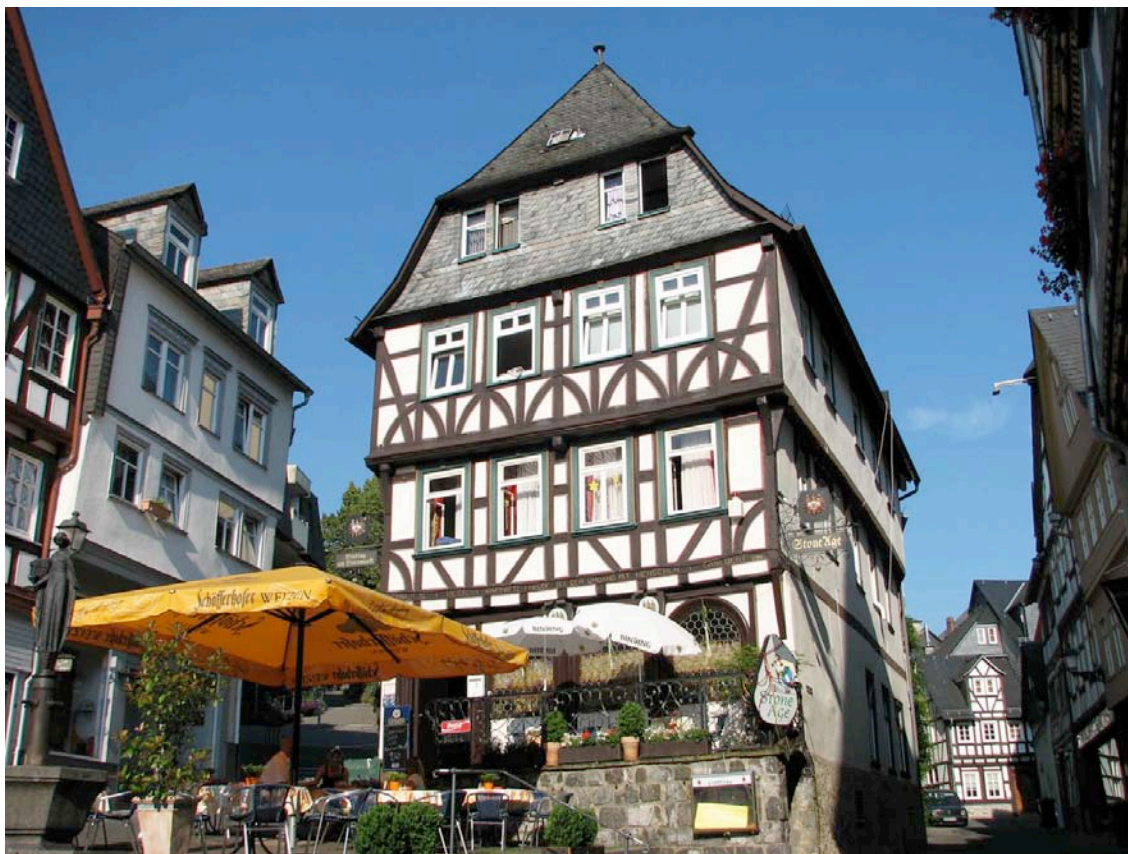
Vista del casco antiguo de la ciudad de Wetzlar

Se trata de una ciudad muy pequeña, aunque cuenta con importantes factorías, como la fábrica de cámaras Leica. El centro histórico es maravilloso con muchísimas casas de entramado de madera y una curiosa catedral con mezcla de estilos. Existen restos de la muralla y dos puentes antiguos sobre el río Lahn. En las fotos puede verse la magnífica arquitectura alemana.