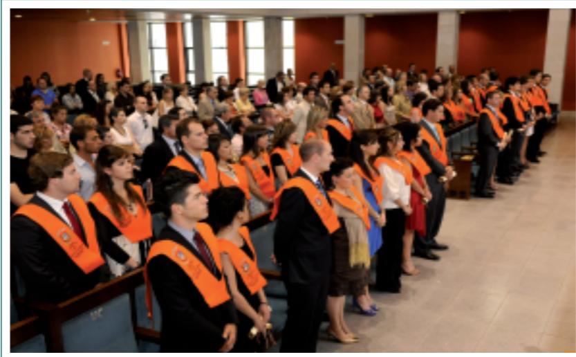
Acto de graduación del Máster en Banca y Mercados Financieros

En el curso 2008-09 se impartieron los siguientes Programas Oficiales de Posgrado: Programa Oficial de Posgrado en Hidráulica Ambiental (que incorpora tres títulos de Máster: Máster en Ingeniería de Costas y Puertos, Máster en Gestión Integrada de Zonas Costeras, y Máster en Gestión Ambiental de Sistemas Hídricos), Programa Oficial de Posgrado y Máster Europeo en Ingeniería de la Construcción, Programa Oficial de Posgrado Máster Interuniversitario en Estudio y Tratamiento del Dolor, Programa Oficial de Posgrado Máster en Biología Molecular y Biomedicina, Programa Oficial de Posgrado en Ciencias, Tecnología y Computación (con cinco títulos de Máster: Máster en Física y Tecnologías Físicas, Máster en Técnicas de Análisis, Evaluación y Gestión Sostenible de Procesos y Riesgos Naturales, Máster en Computación, Máster en Matemáticas y Computación y Máster en Ciencia de los Materiales), Programa Oficial de Posgrado en Adminis-