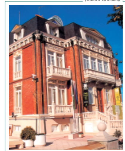
La Residencia (Castro Urdiales)