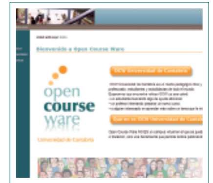
La iniciativa OpenCourseWare (OCW) de la UC fue premiada con uno de los galardones otorgados por el Ministerio de Ciencia e Innovación y el portal Universia.

En el Campus Virtual Compartido (CVC) del G-9, la Universidad de Cantabria ofrece 12 de las 87 asignaturas de libre configuración disponibles. Se han matriculado en ellas 546 estudiantes de la UC y 418 de otras universidades. El número total de matrículas en las 89 el CVC es de 5.769. El CeFoNT se encarga de la logística necesaria para la realiza-