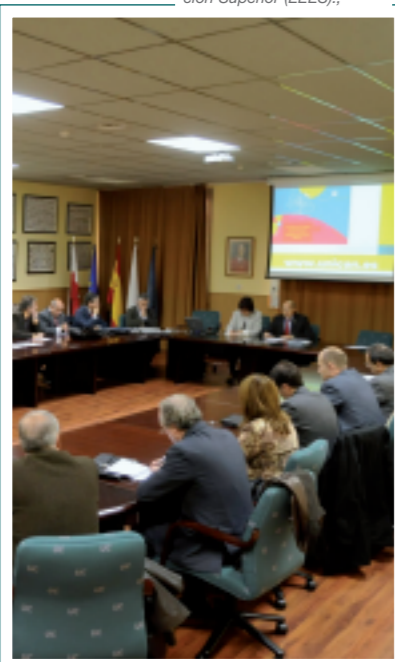
La Universidad de Cantabria presentó las siete primeras propuestas de titulaciones de Grado adaptadas a las exigencias marcadas por el Espacio Europeo de Educación Superior (EEES).

Por último, desde este curso el CeFoNT está inmerso en un profundo proceso de reforma de sus webs, consolidación de datos y mejora de procedimientos administrativos internos.