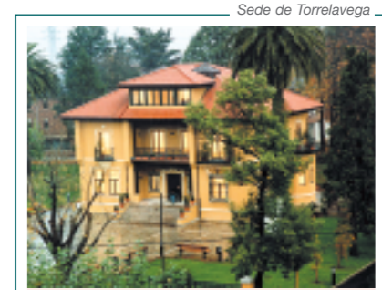
Sede de Torrelavega