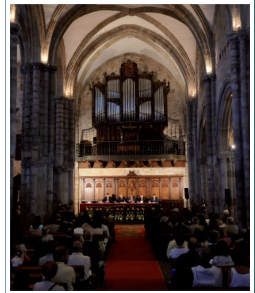
Inauguración de los Cursos en Laredo.

Laredo , sede central de los Cursos de Verano, acogió un total de 11 conferencias y 37 monográficos sobre temas muy diversos: medicina y salud, historia, derecho, tecnología, psicología, educación etc.