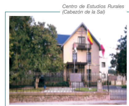
Centro de Estudios Rurales (Cabezón de la Sal)

En Reinosa se celebraron 4 cursos y 2 conferencias relacionados con el Patrimonio Histórico. Los temas abordados fueron de termas a balnearios: arquitectura, agua y salud, del libro código al libro electrónico, museos y sociedad/sociedad y museos y sobre agua, paisaje y patrimonio de los ríos.