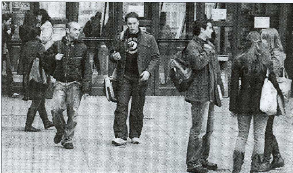
La Comisión de Transversalización elaborará un diagnóstico exhaustivo sobre la equidad de género en todos los sectores del Campus.

Excluido el proyecto de La Remonta que supuestamente coincidía con el del Gobierno